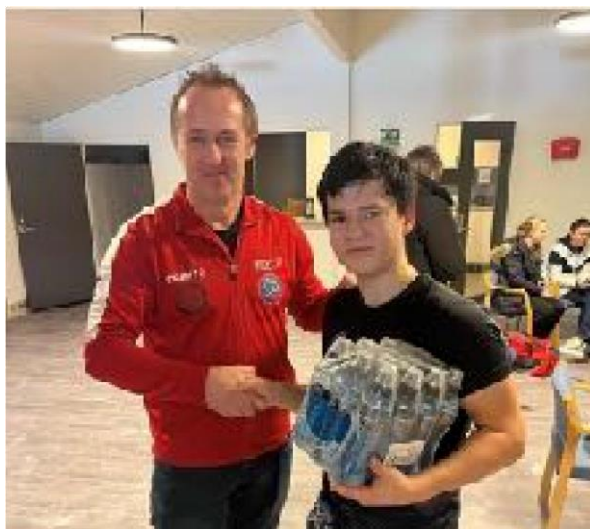
Turneringsleder og den glade vinner av 12 flasker Powerade

Kurs høsten 2023 startet 21. august for barn og 4. september for voksne med 95 deltagere. Antall kursdeltagere gikk totalt sett noe ned i 2023 sammenlignet med året før. Det er voksne og ungdom vi har mistet, barn under 12 år er på samme nivå som i 2022.