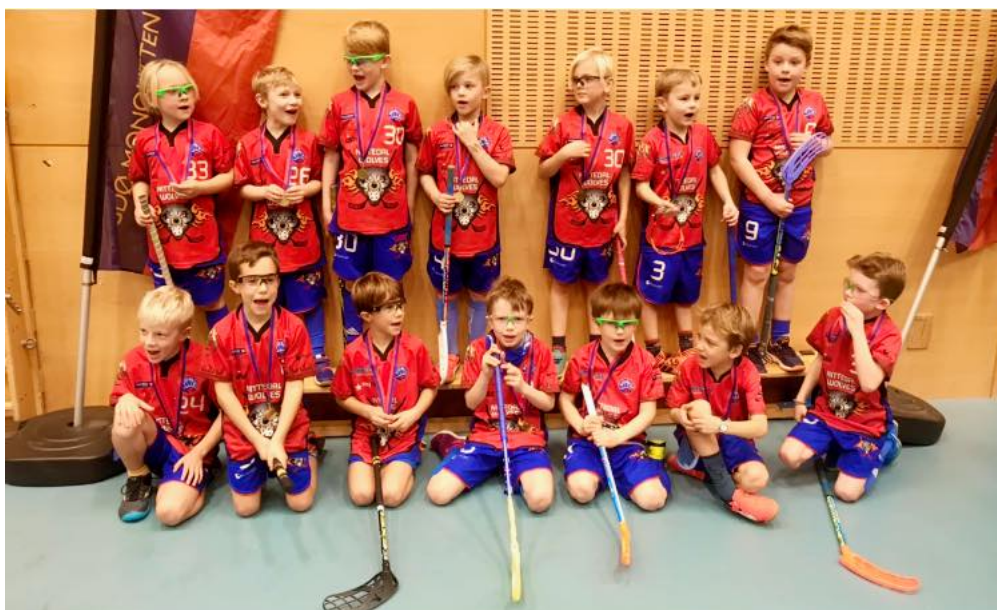
Fornøyd gjeng etter premieutdeling og endt turnering.