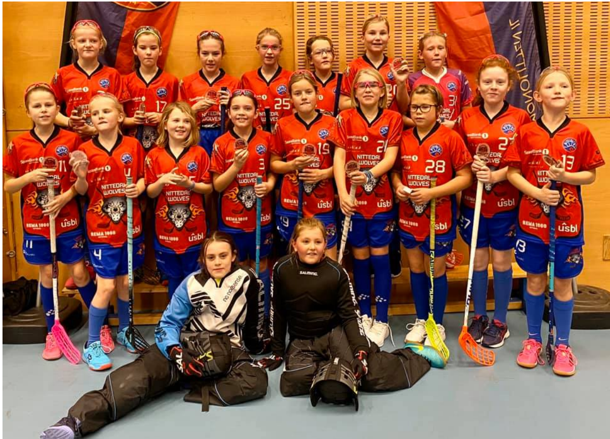
Jentegruppen på besøk hos BMIL