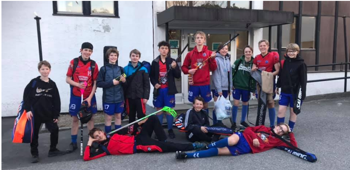
Flotte ulveungdommer på Salming Cup

Det har vært avgjørende med faste trenere, som også stiller til kamp. Spennende å se om trenerne er med videre neste år også.