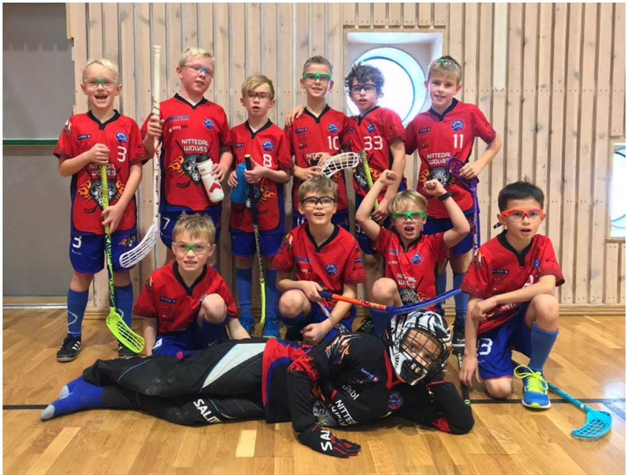
Fornøyde 2010 ulver etter kamp på Lørenskog

Vi ønsker å skape et godt sosialt miljø for gutta. Vi planlegger bl.a. å ha en avslutning for barna etter siste trening denne våren.