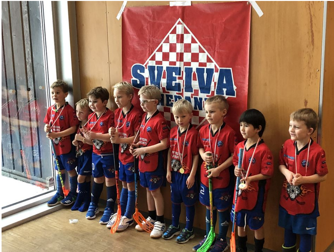
Bilde av Wolves G2013