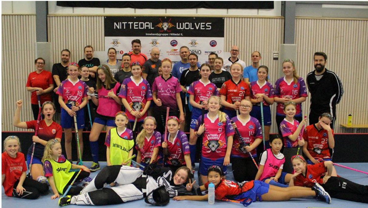
Bilde fra foreldrekampen før jul 2019

Sportslig har jentene tatt steg og som trener er jeg fornøyd med utviklingen til jentegrappa. Vi skal fortsette denne utviklingen og det store målet er å få med flest mulig, lengst mulig. Dette byr på utfordring fremover når jentene begynner på ungdomsskolen. Vi skal dyrke videre på det gode miljøet og satse på at jentene får videre motivasjon i gruppa.