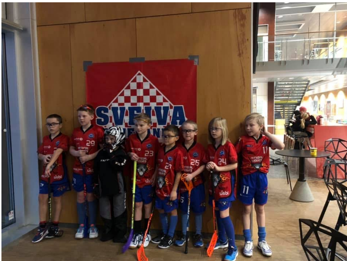
Blide 2011 ulver fra Minirunde til Sveiva.