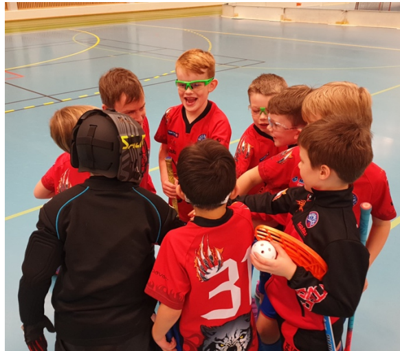
Fornøyde barn under og etter ferdig spilt turnering.