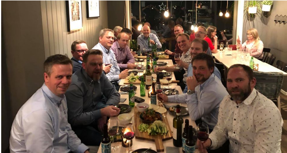
Her er blomsterbuketten samlet til julebord