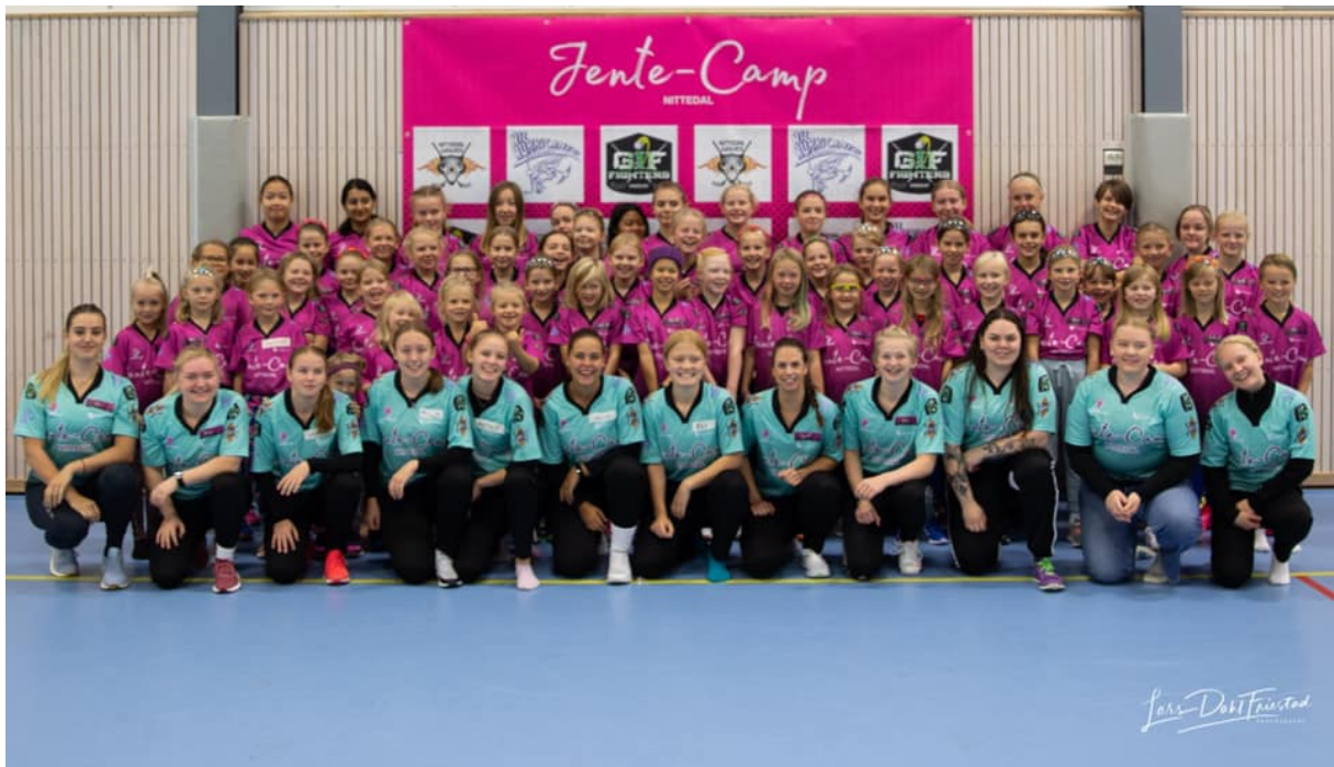
Årets deltakere på Jente-camp 2019

*Jente-Campen vil benytte seg av Hakadalshallen, Rotneshallen og Lihallen