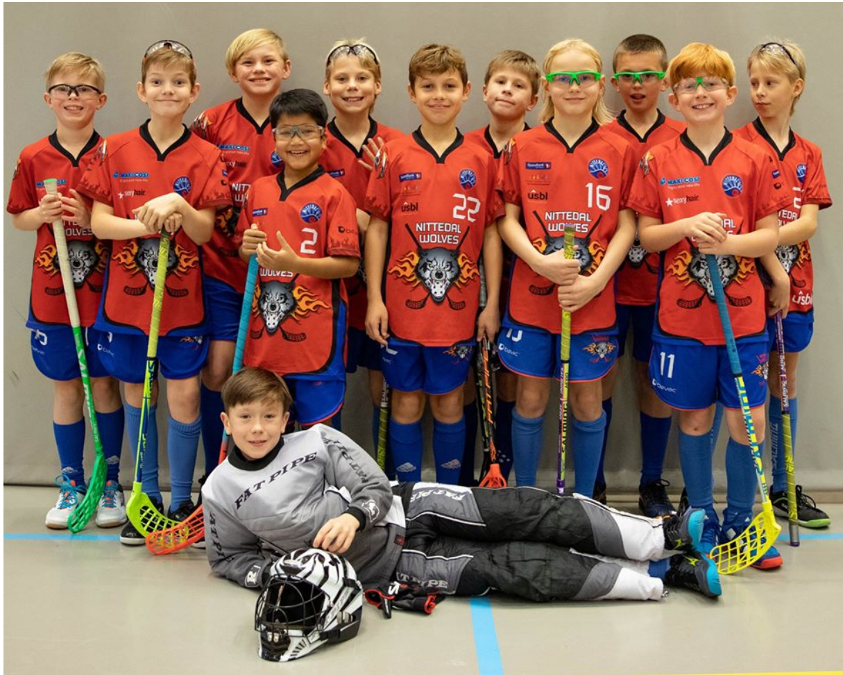
Fornøyde 2009 ulver