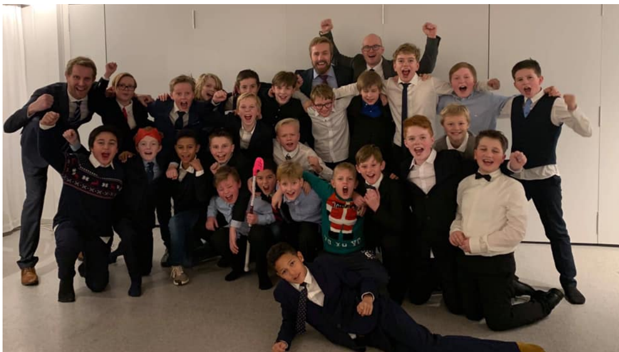
Bilde fra julebordet i 2019