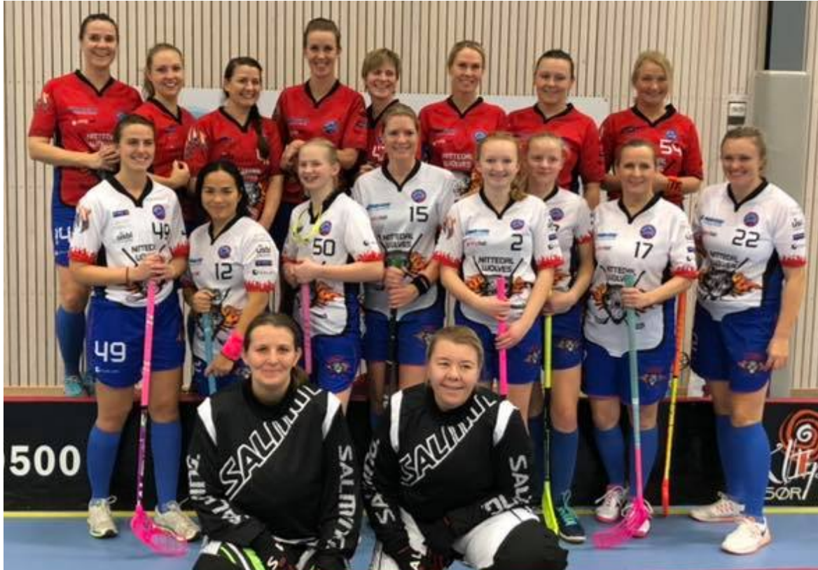
Bilde etter «internkampen» mellom Nittedal 1 og Nittedal 2 i 3. divisjon